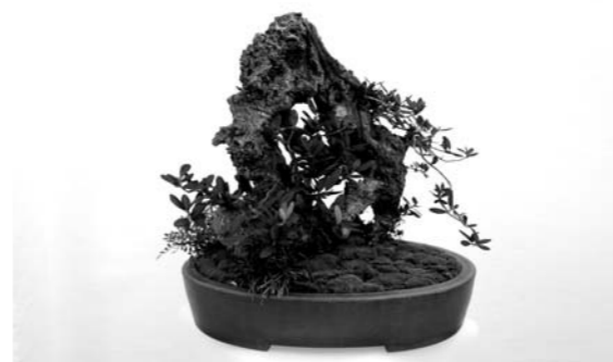
平尾氏がイタリア滞在中に手掛けたオリーブの盆栽。 An olive tree bonsai Hiraio created inspired by his visit to Italy.

Workshops overseas really attract a broad spectrum of people. All ages and levels of ability, and