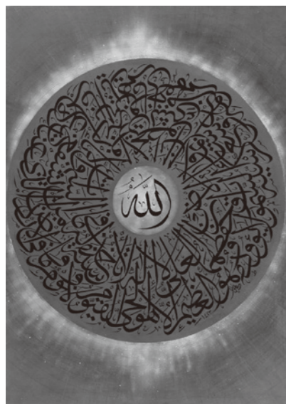
「緑の宇宙」 Green Cosmos (2006)

す。砂漠地帯では昼間は摂氏50度を超える灼熱の暑さ、夜は零度以下に下がることもあります。花や木々、四季の移ろいもない場所ですから、自然の美に対する渴望があったに違いありません。イスラム教は偶像崇拜を禁じていますが、彼らには文字があった。だから、文字によって自然の楽園を享受したのではないのでしょうか。日本には「自然と一体化する」という考え方がありますが、それは恵まれた自然があるからとも言えますよね。アラビア書道という文字芸術は、自然に対するアラブ人たちの切実な叫びでもあると思うのです。