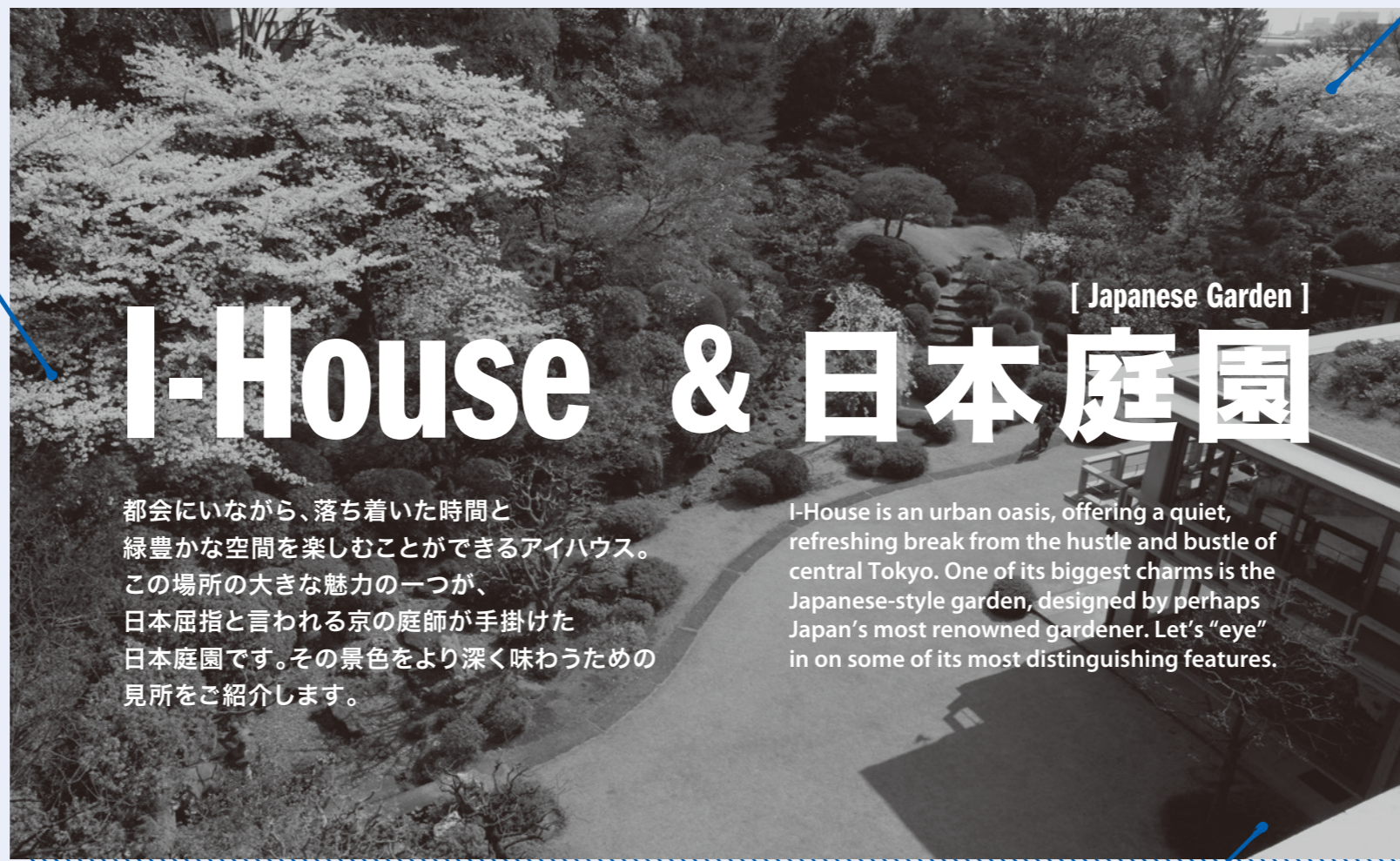
[ Japanese Garden ]