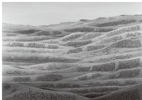
「青の砂漠」Blue Desert (1999); also seen on cover

砂漠の中に風紋のごとく浮かび上がるアラビア文字。青を基調とする色鮮やかな砂漠の丘にコーランの言葉がびっしりと、見事な調和をもって書かれている。本田氏の代表作の一つ「青の砂漠」だ。のちにアラビア書道に一生を捧げることになる本田氏が、かつてサウジアラビアの砂漠で目にした原風景がそのまま写し取られたかのような世界観——その神々しさに思わず息を飲んだ。