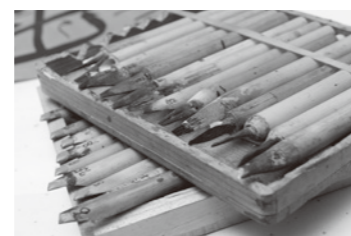
8種の字体、表現したい線の太さによって、使い分けられる筆。竹や藁を使い、書家自らが作る。Arabic calligraphers make their own pens for eight scripts and different thicknesses of line.

This goes back more than 40 years ago, but after I graduated from university I went through a period when I was quite troubled by existential questions and groping for what path I should pursue in life. I experimented with a number of arts—sculpture, painting, poetry—but couldn't find the right vehicle for expressing the feelings I had bottled up inside. At that point, I had a chance meeting with a friend who said he was going to Saudi Arabia to make maps for a Japanese surveying company, and asked me if I would like to go along as an interpreter. I said yes. The survey team was about 20 people altogether—surveyors and interpreters from Japan, local drivers and cooks. We were camping out in the desert every day, collecting information on the location of wells, the names of wadis and hills. When I saw the completed maps, I was totally overwhelmed by the beauty of meticulously rendered place names in Arabic script. Fortunately, one of the members of the survey team was a Saudi calligrapher, and I asked him to start teaching me the basics of Arabic calligraphy.