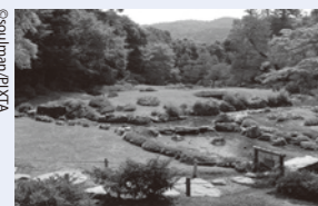
Ueji, or Ogawa Jihei VII (1860–1933), was a famed gardener active in the Meiji through the early Showa eras best known for his works around Kyoto, including Maruyama Park, Heian Shrine, and the villas in the neighborhood of the temple Nanzen-ji. Particularly famous is the Murin'an garden (photo) that uses the Higashiyama hills as a backdrop and features a small stream fed by the waters of Lake Biwa. The only gardens by Ueji one can visit today in Tokyo are those at the I-House and the Kyu-Furukawa Gardens. Gardens in Kyoto are often laid out beautifully as microcosms of nature containing a pond, artificial hills, and lawns, where visitors can enjoy the changing scenery. Ueji added to that the dynamic movement of flowing water, which became the hallmark of his modern gardens.

国際文化会館(アイハウス)に残る日本庭園を手掛けた、小川治兵衛(1860~1933、通称・七代目植治)をご存じでしょうか。小川治兵衛は、明治から昭和初期にかけて京都を中心に活躍し、円山公園や平安神宮、南禅寺・東山界隈の別荘群の名だたる庭園を手掛けた日本屈指の庭師。東山の借景を生かし、琵琶湖疏水を引き入れた無鄰菴(写真)は特に有名です。治兵衛の庭を現在の東京で見られるのは、アイハウスと旧古河庭園だけ。都心にながら「京都の庭」をめぐることができます。京都の庭には、池泉・築山・芝生広場などを使って自然の縮景を表現したものが多く、庭の中を歩きながら景観の変化を楽しめます。そうした伝統美を損なわずに、自然の景観に躍動的な水の流れを大胆に組み入れたのが、治兵衛の庭の特徴です。