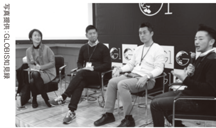
2017年、ジェンダーと多様性を考えるシンポジウムにて At a conference on gender and diversity in 2017.

これは心と身体の性が一致しない人に、戸籍上の性別変更を認める法律ですが、変更には厳しい条件がいくつも付けられています。HRWがとりわけ問題視しているのが、断種手術(生殖性が永遠にない状態にするための不妊手術)の強要です。誰もが持っている「性と生殖に関する権利」を永遠に奪うことでしか、その人の性別を認めないというのは、明らかな人権侵害ですし、それを手術という方法で行うのは一種の拷問だとの見方を国連の専門家も示しています。先進国でこうした義務を課している国は減ってきており、日本も早急に改正する必要があります。