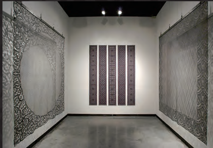
Eon [2008, Delaware Center for Contemporary Arts, Works from right to left: Sieve, Daisy Runners, Granulated Diamond]

布には歴史や記憶が宿ると考えるシェパードは、一枚布からレースのような透かし模様を切り出す緻密な作品を手がけています。今春から日本で染めを学ぶ彼女が、自身の作品について語ります。Shepard's work is a refined process of cutting whole cloth into lace-like patterns, considering fabric in relation to history and memory. She will talk about her art in light of her study of pattern dyeing and paste resist in Japan.